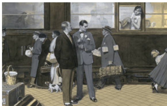
15. FLOR DE ILUSIÓN, 29 DE ENERO DE 1933. MUSEO ABC, MADRID