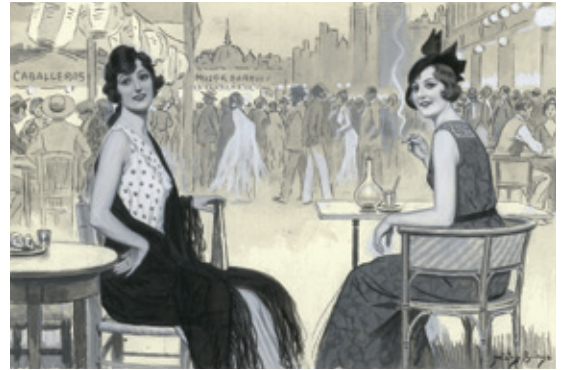
08. MIENTRAS MADRID CRECE... DOS PARTIDOS, 10 DE JULIO DE 1932. MUSEO ABC, MADRID