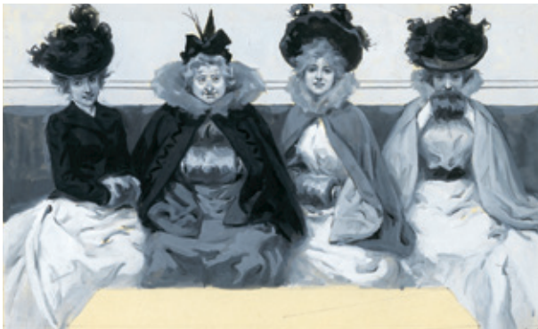
09. LAS DE GUAGUA, 1º, 15 DE DICIEMBRE DE 1900. MUSEO ABC, MADRID