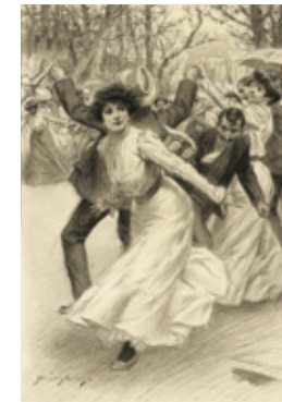
11. LAS MAÑANAS DEL RETIRO, EL RATÓN Y EL GATO, 22 DE ABRIL DE 1905. MUSEO ABC, MADRID