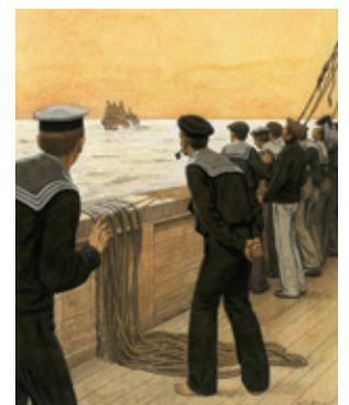
16. EL GALEÓN Y LA SIRENA, 1º, 23 DE FEBRERO DE 1930. MUSEO ABC, MADRID

EN LA CARA FRONTAL: IMAGEN DE LA EXPOSICIÓN CON LA ILUSTRACIÓN: LAS CARRERAS DE OTOÑO, 3º, 6 DE NOVIEMBRE DE 1897. MUSEO ABC