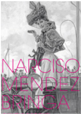
01. IMAGEN DE EXPOSICIÓN