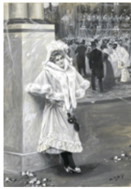
03. BAILE DE CARNAVAL, 2 DE ENERO DE 1897. MUSEO ABC, MADRID