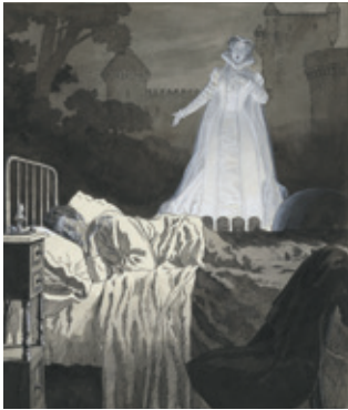
05. CUENTO. EL VALS DE LA BARRIENTOS, 2º, 23 DE MAYO DE 1926. MUSEO ABC, MADRID