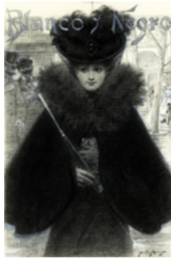
07. DESPUÉS DE MISA, 2 DE DICIEMBRE DE 1899. MUSEO ABC, MADRID