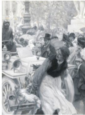
06. CASTILLA Y LEÓN, 2º, 6 DE ENERO DE 1906. MUSEO ABC, MADRID