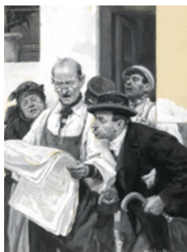
14. LA DESTRUCTORITA, 1º, 16 DE ABRIL DE 1904. MUSEO ABC, MADRID