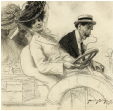
02. AUTOMOVILISTAS, 7 DE OCTUBRE DE 1905. MUSEO ABC, MADRID