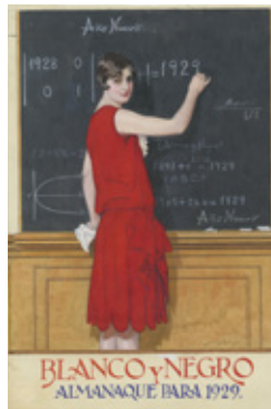
10. ALMANAQUE PARA 1929, 30 DE DICIEMBRE DE 1928. MUSEO ABC, MADRID