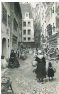
13. AGUAFUERTE, 2º, 3 DE FEBRERO DE 1924. MUSEO ABC, MADRID