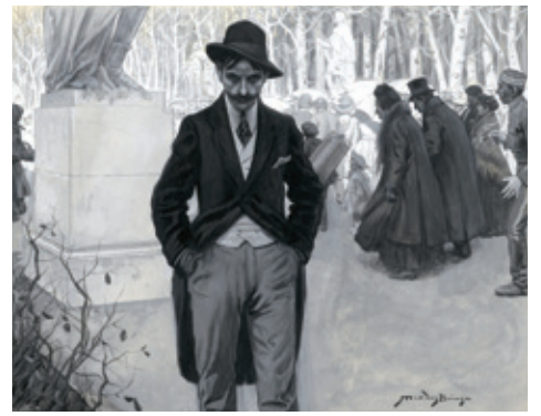
04. EL FILÓSOFO Y LA MARIPOSA, 1º, 21 DE MARZO DE 1909. MUSEO ABC, MADRID