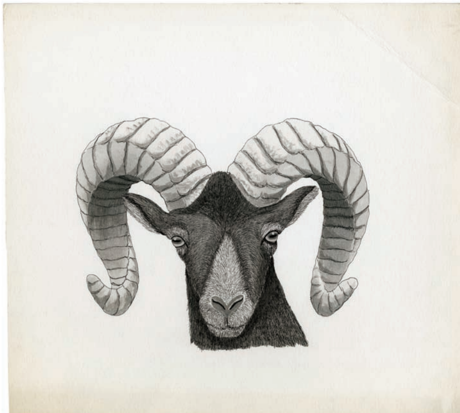
Fernando López Herencia, Diario de una cacería en la baja California, 2º . El borrego cimarrón , Trofeo, núm. 125, ca. octubre de 1980.