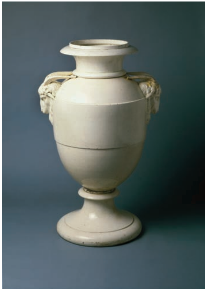
Cerámica de Alcora Jarrón 3ª a 4ª Época (1786 - 1858) Altura 84 cm Colección Banco Santander