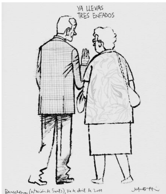
Barcelona, Estación de Sants · 14/04/2011