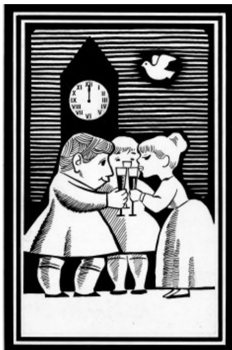
Sebastián Rey Padilla, Diseño de billete de Lotería. Serie «Refranero popular». Año nuevo, vida nueva. Ilustración para un Aleluya. 1969. Tinta sobre papel estucado, 195 x 130 mm. ARCHIVO HISTÓRICO MUSEO SELAE