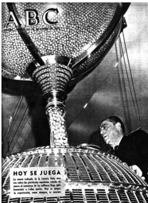
Portada. ABC, núm. 20.825, 22 de diciembre de 1972