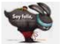
LIBRO 15 Soy feliz, no me preocupo.