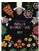
LIBRO 22 A Garden in My Heart.