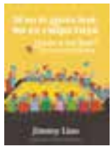
LIBRO 17 Si no te gusta leer, no es culpa tuya.