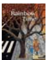
LIBRO 20 The Rainbow of Time.