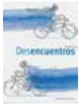
LIBRO 12 Desencuentros.