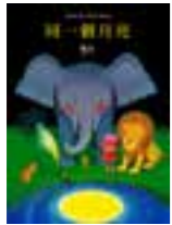
LIBRO 21 Under the Same Moon.