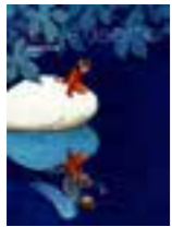
LIBRO 14 Paisaje de amor.