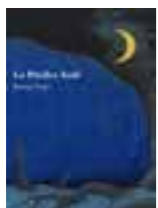
LIBRO 19 La piedra azul.