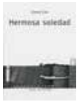
LIBRO 18 Hermosa soledad.